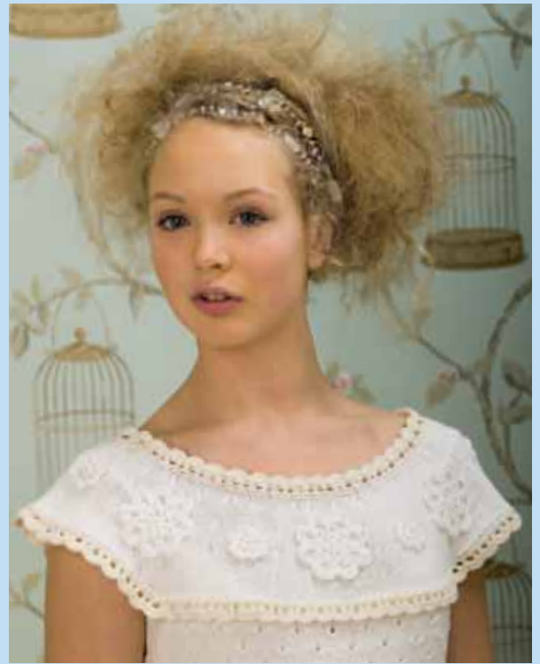
Nr. 18709 Design: Ane Sæthre Stork XXS-XL