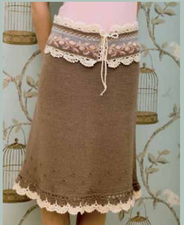
Nr. 18702 Design: Ane Sæthre Daletta XS-XL