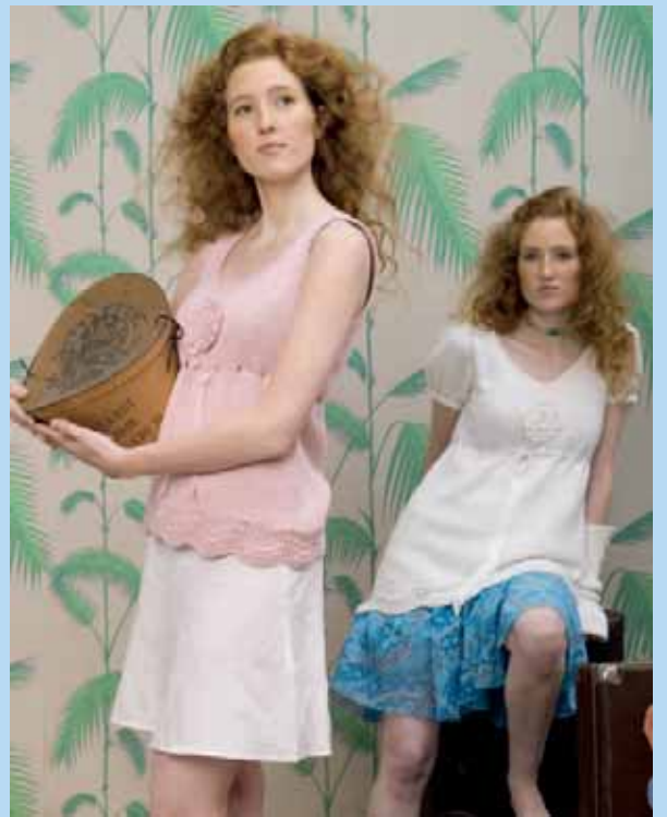
Nr.18713 Design:Ane Sæthre Svale XS-XL