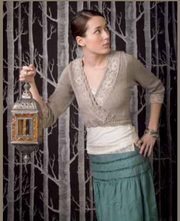
Nr. 18706 Design: Ane Sæthre Svale XXS-XL