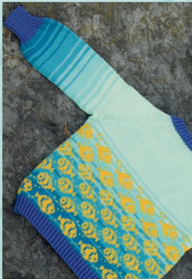
Nr. 20904 Design: Kari Haugen Falk, str 2 – 6 år