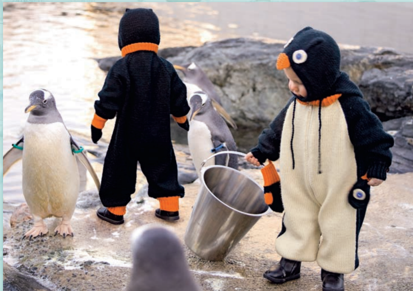
Nr. 20901 Design: Kari Haugen Freestyle, str 1-4 år